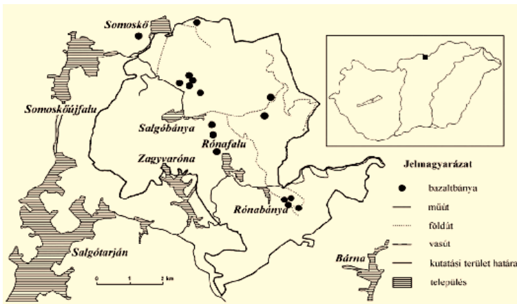
2. ábra A vizsgált terület

Kutatási területként az 1989 óta védelem alatt álló Karancs-Medves Tájvédelmi Körzet Medves-fennsíkot is magába foglaló 32 km 2 -nyi részét (2. ábra) választottam. A területet az emberi tevékenység – különösen a több, mint 100 évig tartó bányászat – jellegzetes ipari (művi) tájjá alakította. A bányászat befejezése óta a turizmus jelentőségének növekedésével előtérbe került a táj szépsége, mint turisztikai vonzerő. Ennek megőrzése, illetve visszaállítása a térség szakembereinek és lakosságának a közös munkájával válhat valóra.